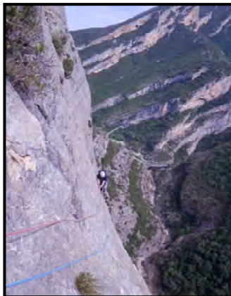
Flanquejos aeris a la Gali-Molero