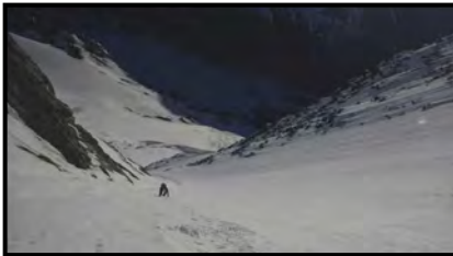
Els primers 500 m del couloir Pallavicinni, neu entre 50-55°