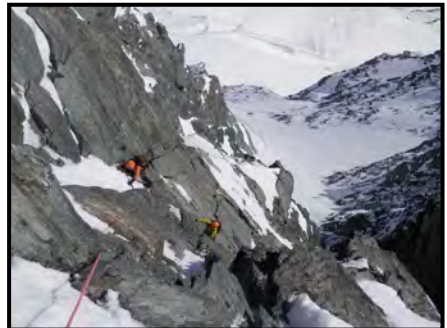
Sortida en roca del couloir Pallavicinni