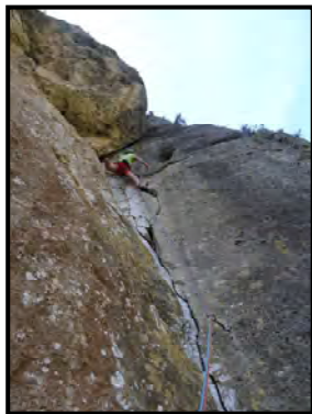
Directa a lo Puro