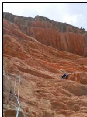
Llargos superiors de la Cistus albidus