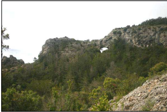
LA FORADADA DESPRÉS DE PASSAR PEL RACÓ DEL TEIX.

Per la segona jornada sortim des de Mont-ral en direcció a ponent seguint els indicadors que ens portarien cap a La Foradada, però de seguida deixem el camí més fressat i prenem un corriol que va cap a la dreta i que ens porta fins al Racó del Teix, un enclavament solitari, rodejat de grans parets de roca que li atorguen un microclima humit i ombrívol i on hi destaca un teix centenari. Deixem aquest indret per