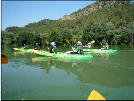
PIRAGÜES AL RIU EBRE.

** Estem acabant d'enllestir els nous carnets de socis del CECMO, que aquesta vegada realitzarem en col·laboració amb la botiga de muntanya de CAMP BASE de Sant Cugat del Vallès. Amb l'enviament del proper butlletí us els farem arribar.