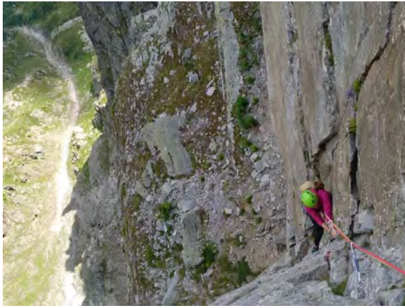
Ex-Libris. Cara Est de Le Brevent.