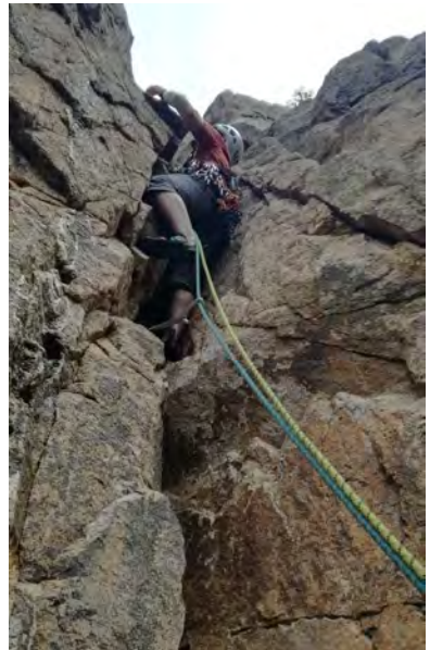
Sortida L2. Aresta del Ger

Via clàssica semi-equipada amb algun pitó als passos clau i R2 rapelable ( possible abandonar). Resta fàcil de protegir. Roca excel·lent. Grau amable, perfecte per jugar amb flotants. Un bon racó, molt tranquil, on caldrà explorar una mica més. Poca aproximació, tranquil·litat i molt bona roca!