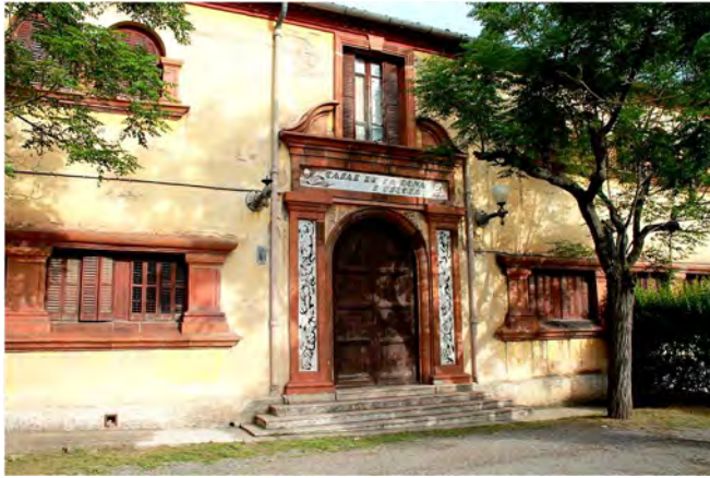
Casal de la Dona. Puigreig.

Cal Rosal (Berguedà meridional) i Balsareny (Bages) es connecten a través de l'itinerari PR C-144. Es tracta d'una ruta que ressegueix el curs del riu Llobregat i que transcorre entre camps de conreu, boscos i una frondosa vegetació de ribera