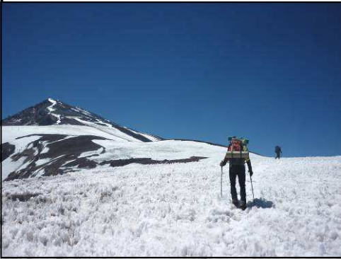
EL MARMOLEJO, AL FONTS.

A les 4.00 sona el despertador, hem dormit ben poc a causa dels nervis, però ens trobem bé i estem animats. El termòmetre marca -12^{\circ}\text{C} dins l'entrada de la tenda. Sortim a les 5.30, comencem amb la travessa de la glacera, que per sort té pocs i petits penitents. Algunes esquerdes no ens permeten avançar recte, el què ahir semblava una travessa curta, es converteix en més de dues hores de dura caminada pel gel. Després d'això, ens queden uns 600-700 m de desnivell força drets i sense repòs per un terreny entre sorrenc i pedregós. Al principi avancem a poc a poc però amb ànims i físicament bé. Els últims aproximadament 300 m de desnivell però, es converteixen en un infern per a mi. Mentre veig els meus companys avançar lenta però constantment, jo sóc incapaç de fer més de deu o vint passes seguides, el cim sembla tan lluny! Però els seus ànims i la il·lusió em permeten esgarrapar forces d'algun raconet i em concentro en cada pas i cada inspiració per avançar.