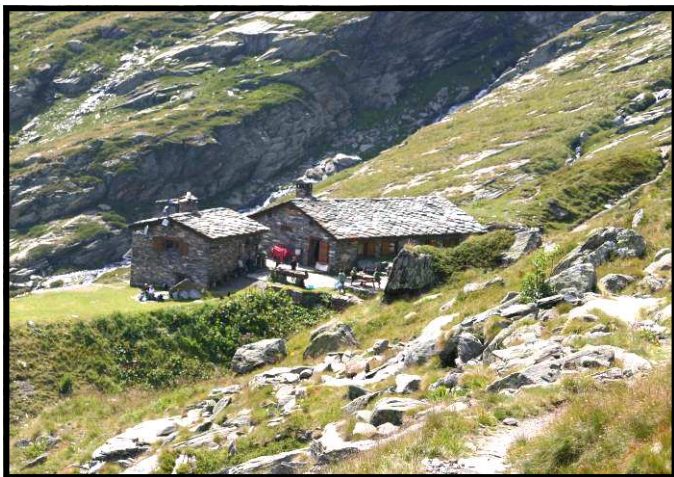
EL REFUGI DE L'ARPONT.

La quarta jornada, que ens portarà fins al refugi de l'Arpont, comença amb un suau descens pel llarg Col de la Vanoise, rodejats de petits estanys, i que en acabar-se ens obre unes magnífiques panoràmiques sobre les valls de llevant de la glacera. Sense perdre ni guanyar grans desnivells, arribem a l'acollidor refugi de l'Arpont ( 2309 m.).