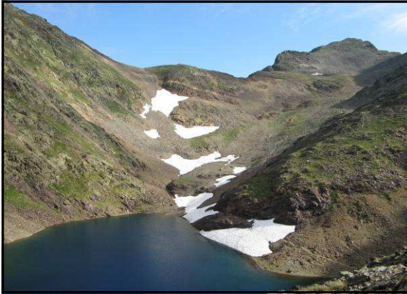
L'ESTANY NEGRE, SOTA EL COMAPEDROSA.

La primera ruta que us presentem és l'ascensió al cim del Comapedrosa, el punt més alt del Principat d'Andorra ( 2939 metres). Deixem el cotxe després de creuar el túnel de la carretera que va d'Arinsal al Pla de l'Estany. (1600 m.). Comencem a caminar seguint el GR-11 que va remuntant el riu de Coma Pedrosa, fins al refugi de Coma Pedrosa (2280 m), que ens queda a la nostra esquerra. Estem en un petit altiplà que l'atruvessem, i de nou el camí s'enfila fort fins a Les Canyonques, on deixem la part més rociosa per entrar en un camí molt més herbat. (2500 m.). Després de pujar una mica més arribem a l'Estany Negre, on deixem el GR-11 que voreja el llac i ens enfilem per un camí a la dreta que ens portarà fins al cim del Comapedrosa.