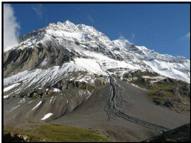
EL CIM DE LA GRAND CASSE.

El segon dia el camí comença enfilant-se fort cap al Col d'Aussois (2916 m.), des d'on si el dia es presenta bo podem assolir fàcilment el P o i n t e de l'Observatoire de 3016 metres. Baixem el coll fins a la vall que veiem als nostres peus on trobem les