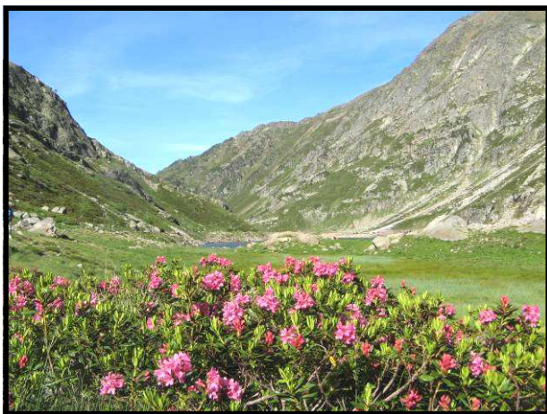
DESPRÉS DEL LLAC DE NAGUILLE

al fons hi veiem el Coll d'En Beys. El camí, tot i que no té dificultats tècniques, és pedregós i a vegades transcorre per entre grans blocs, el que fa que la marxa sigui més lenta i treballada. A la nostra dreta, i una mica més avall hi deixem els llacs de Peyrisses i finalment creuem el Coll d'En Beys (2345 metres).