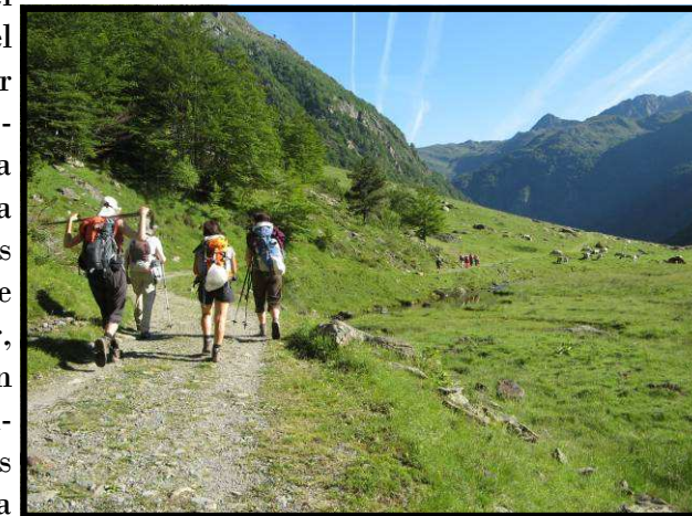
BAIXANT DEL REFUGI D'EN BEYS.

Des del refugi ( 1970 metres) hi ha moltes possibilitats, com ara enllaçar amb el Tour del Carlit, fer una ruta circular cap al Puig de la Grave i llac de Lanoux, enllaçar cap al refugi de Besines o de les Bulloses, etc. Per fer un circuit circular i retornar al punt d'inici a Orlú es pot fer el descens seguint el GR-7 que baixa per l'interior de la reserva de fauna d'Orlú. Es tracta d'un descens més senzill que l'utilitzat per pujar, seguint primer un corriol que ens deixa en un camí més ampla una vegada hem arribat al inici de la vall, quant el paisatge es suavita.